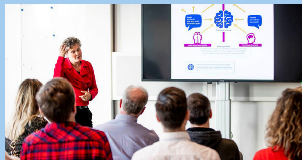
Zorg- en veiligheidsprofessionals leren meer over het signaleren en melden van mogelijke radicalisering tijdens een training