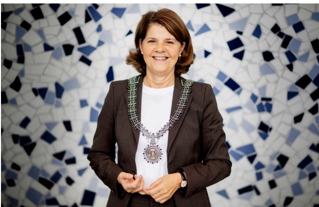
Marja van Bijsterveldt, burgemeester van Delft

Maar hoewel onze inzet op preventie de komende jaren hierdoor versterkt wordt is de werkelijkheid dat nu en in de toekomst mensen toch in moeilijkheden komen en er samenwerking tussen meerdere ketens nodig is. En dan zijn we blij met de Zorg- en Veiligheidskamer zoals we die in Delft hebben!